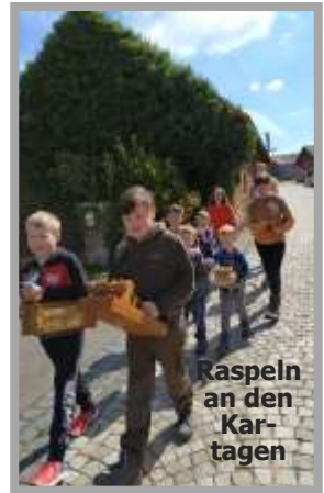
Raspeln an den Kartagen