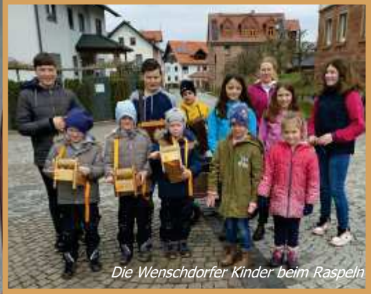
Die Wenschorfer Kinder beim Rospeln