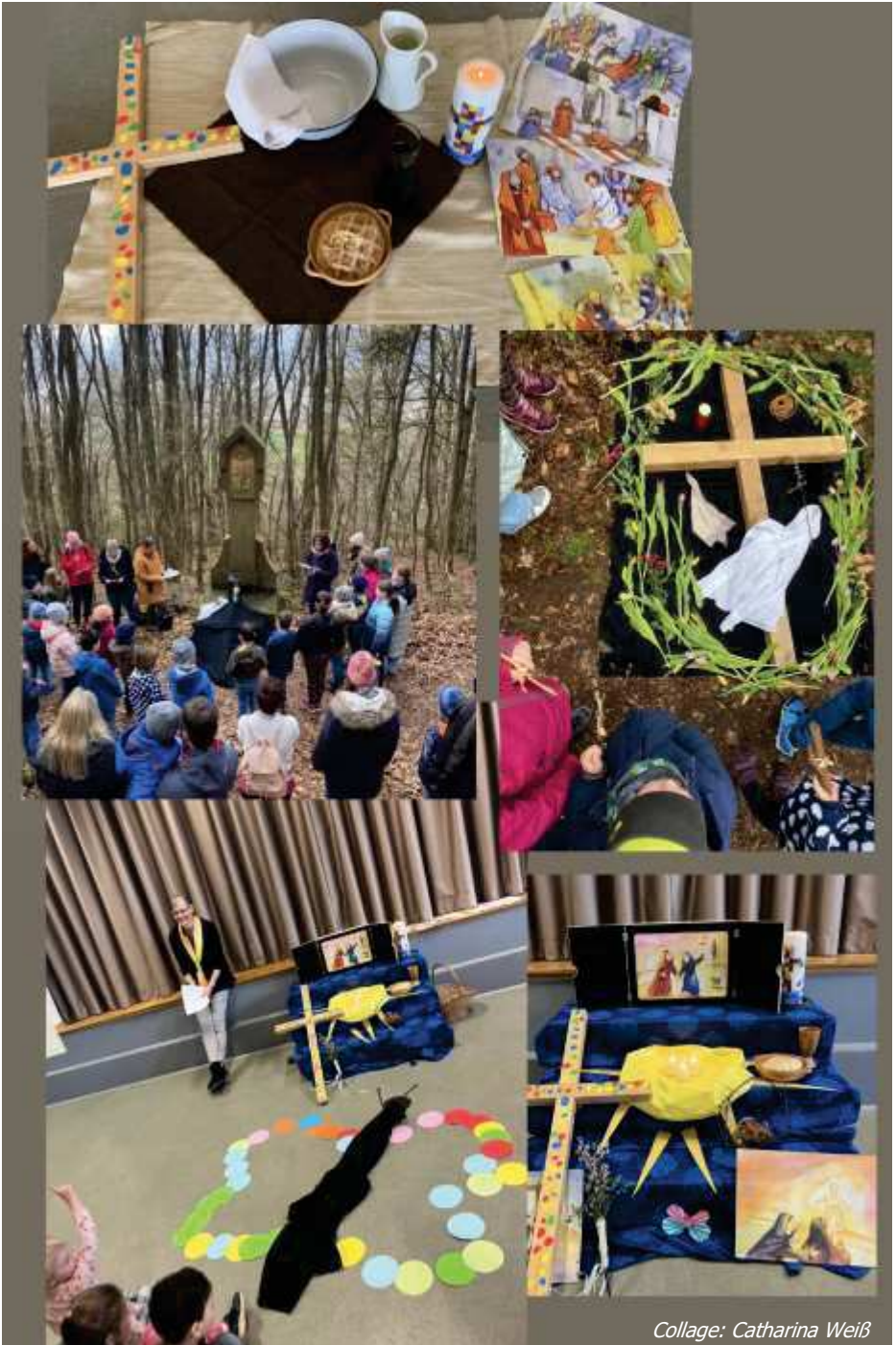
Collage: Catharina Weiß